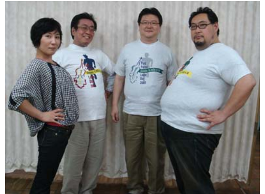
Bassoonable チビT?? 着てみた